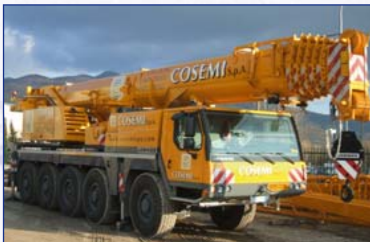
AUTOGRÙ LIEBHERR LTM 1095