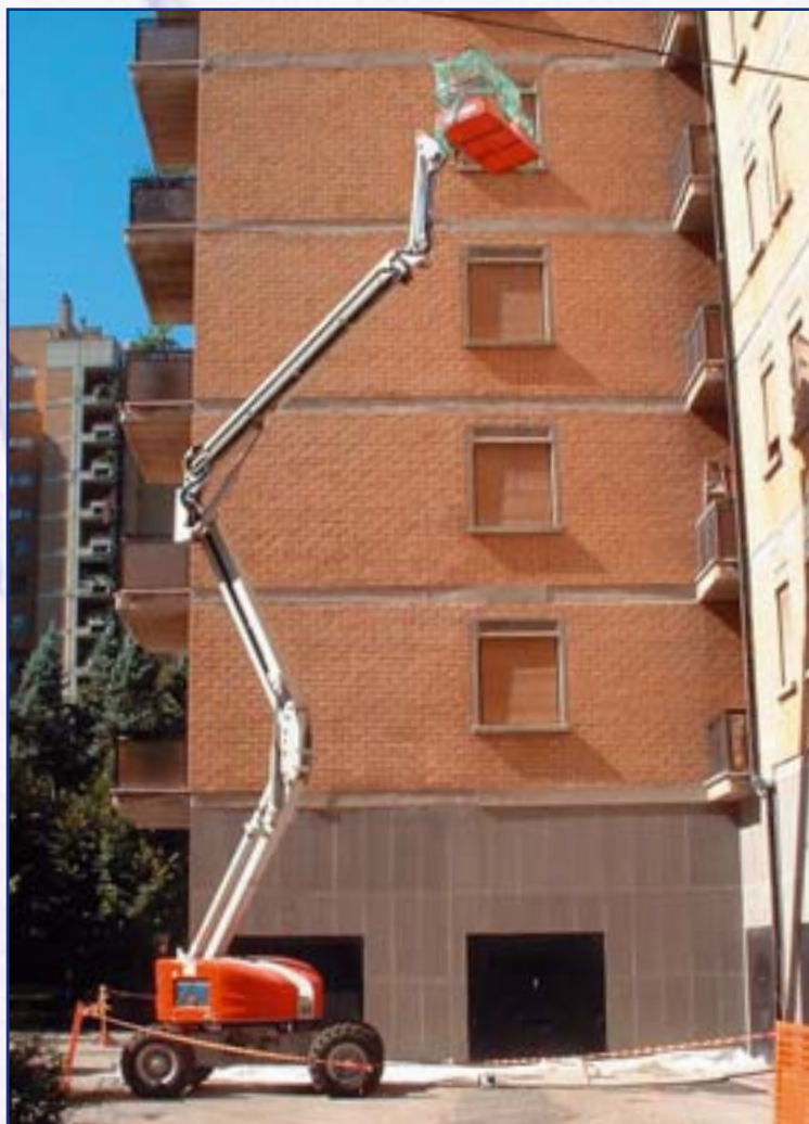
PIATTAFORMA AEREA Piattaforma Basket da 23 mt.