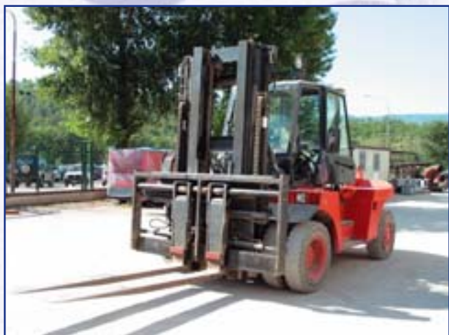
CARRELLO ELEVATORE Carrello da 12 Ton.