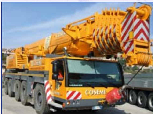
AUTOGRÙ LIEBHERR LTM 1200