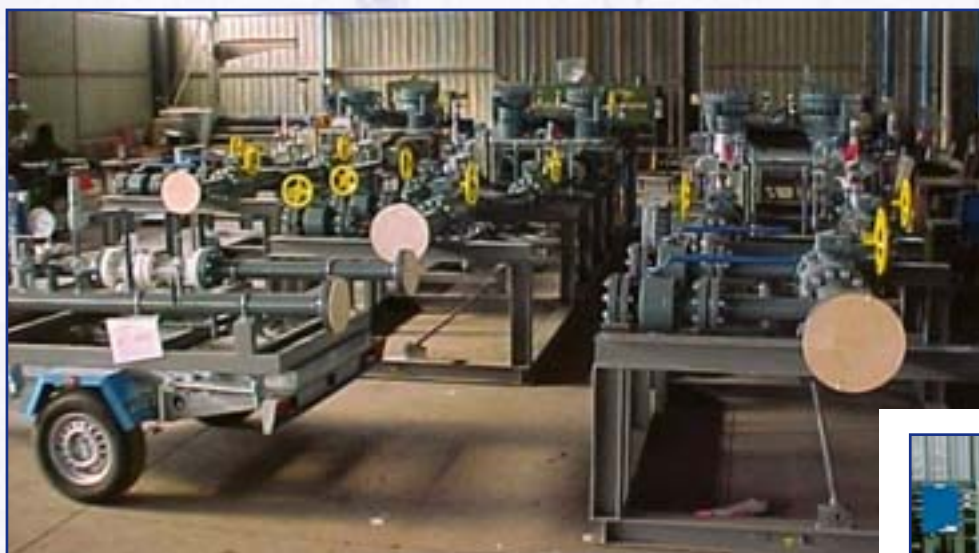
METERING SKID per conto Progetti Europa & Global · Algeria

PREFABBRICAZIONI CARPENTERIE · MECCANICHE · PIPING · CALDARERIA