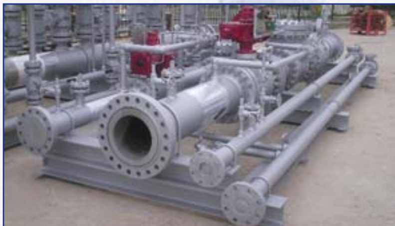
REALIZZAZIONE WATER INJECTION SKID per conto Progetti Europa & Global · Iraq